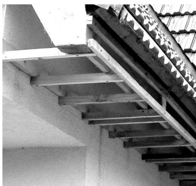
nosný rošt z dřevěných latí

Veškeré doplňkové profily a plastové palubky se musí připevňovat k nosnému roštu min. každých 30 cm (tmavé barvy 15-20 cm). Palubky se do sebe musí pouze volně zasouvat (nedotlačovat silou). Na svislých částech podhledu je vždy potřeba začít klást palubky od horního okraje obkládané plochy směrem dolů tak, aby jednotlivé palubky byly otočené vždy perkem nahoru a drážkou dolů. Barevné a foliované palubky je nutné kvůli tepelné roztažnosti při použití na plochách exponovaných slunečním zářením montovat maximálně ve 3 metrových délkách.