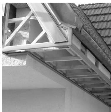
osazené doplňkové profily a první palubka