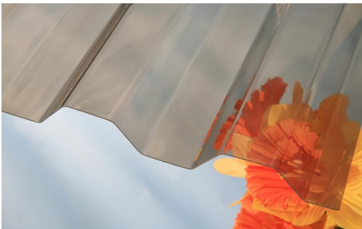
MARLON CS TR 76/16 0,8 mm bronz