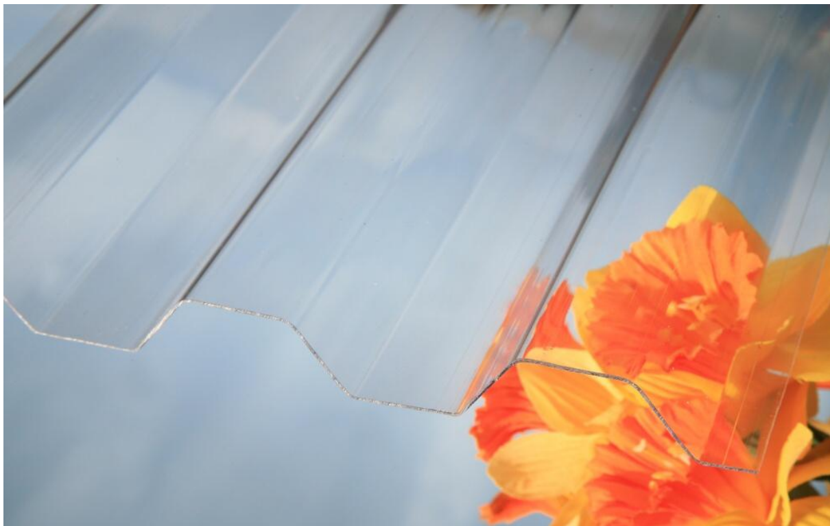
MARLON CS TR 76/16 0,8 mm čirá