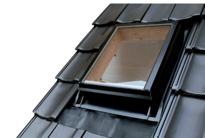
Obr. č. 6b