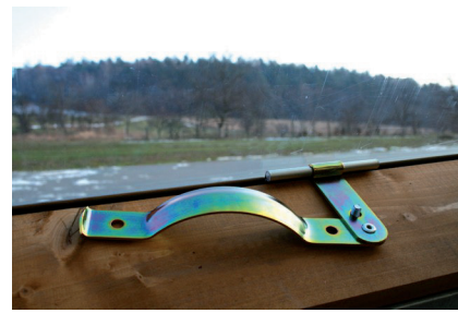
Obr. č. 7