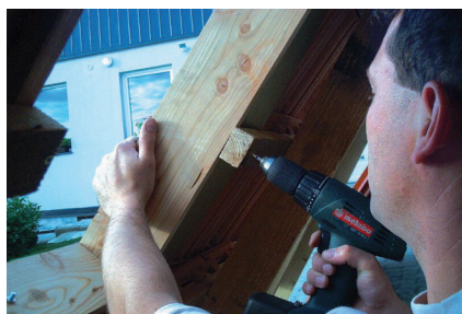
Obr. č. 5