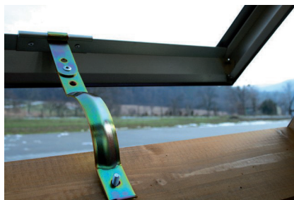
Obr. č. 9