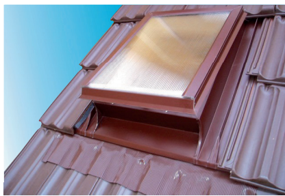
Obr. č. 6