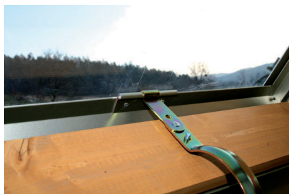
Obr. č. 8